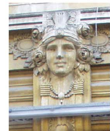
Particolari degli stucchi