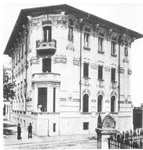
Il Villino Astengo in una foto d'epoca.