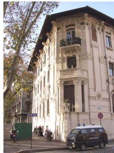
Il Villino astengo oggi