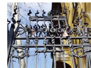
Particolari delle lavorazioni in ferro