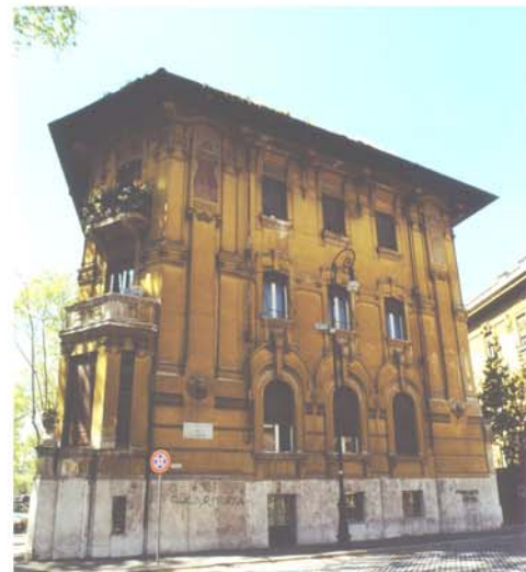
Il Villino astengo ante operam