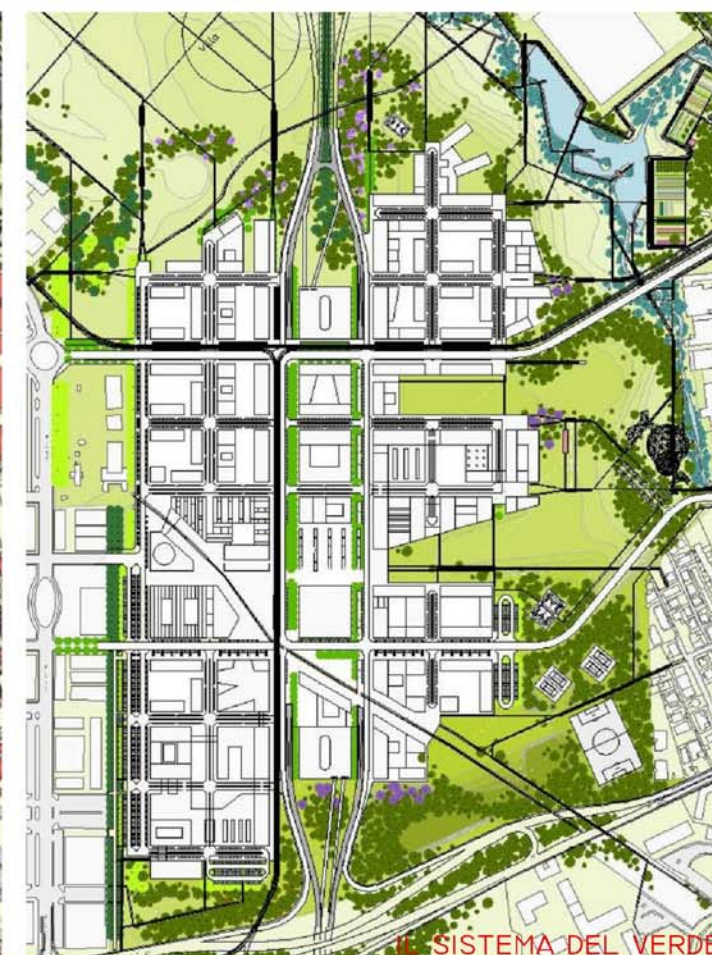
IL SISTEMA DEL VERDE