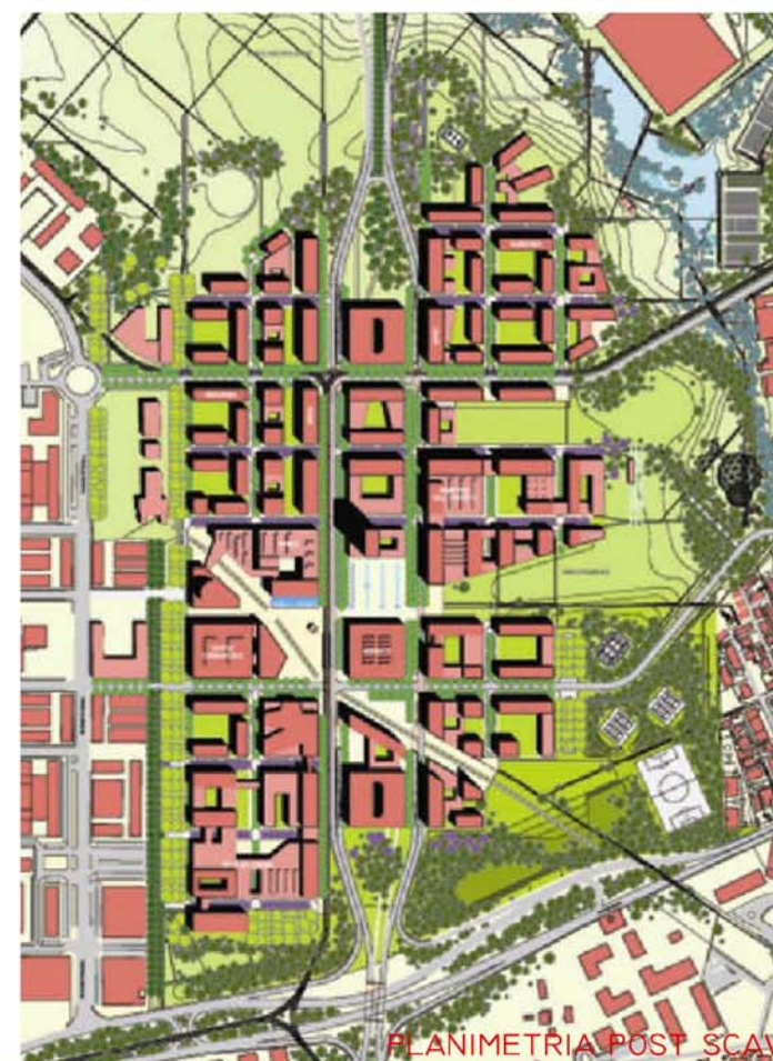
PLANIMETRIA POST SCAVI