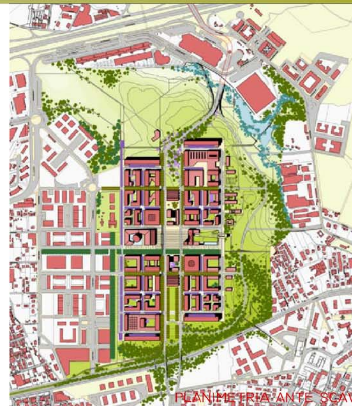
PLANIMETRIA ANTE SCAVI